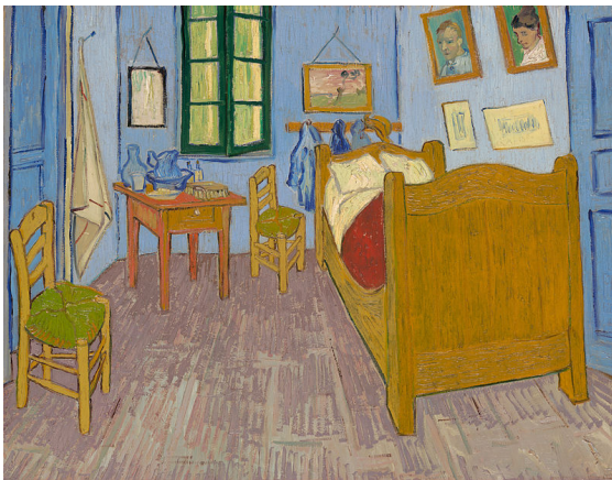
Vincent's Schlafzimmer in Arles, 1889

Das Schlafzimmer in Arles oder Vincent's Schlafzimmer ist der Titel von drei Ölgemälden und zwei Zeichnungen in Briefen, die der Künstler zwischen 1888 und 1889 im sogenannten Gelben Haus in Arles schuf.