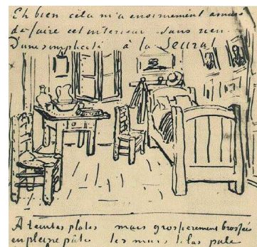
Vincent's Schlafzimmer. Brief vom 17. Oktober 1888